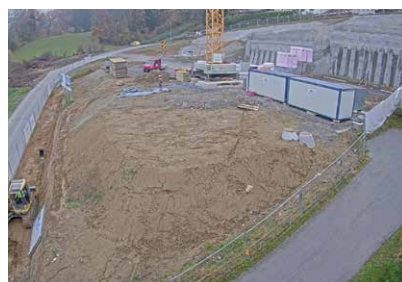
Nov 21 Webcam zeigt die Baustelle.