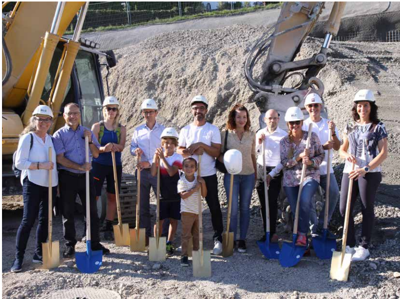
Sept 21 Spatenstich und anschliessende Feier mit den neuen Eigentümern.