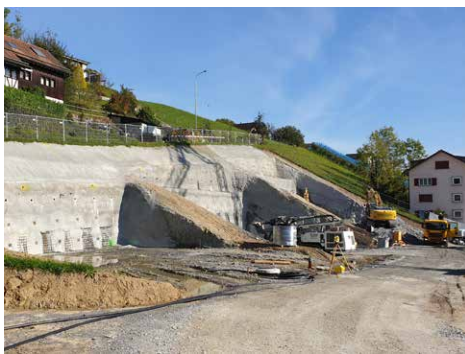
Okt 21 Aushub & Hangsicherung mit Erdnägeln.