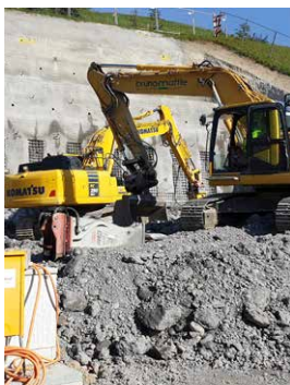
Okt 21 Aushub & Hangsicherung mit Erdnägeln.