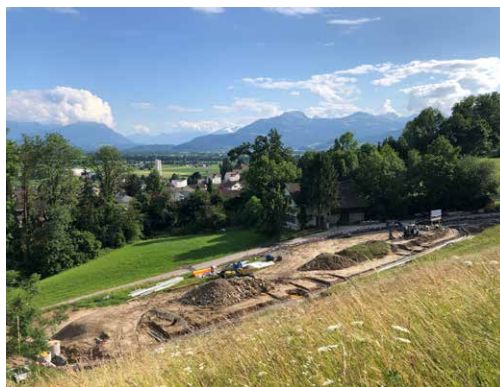
Sept 21 Baustellenaussicht mit Weitblick.